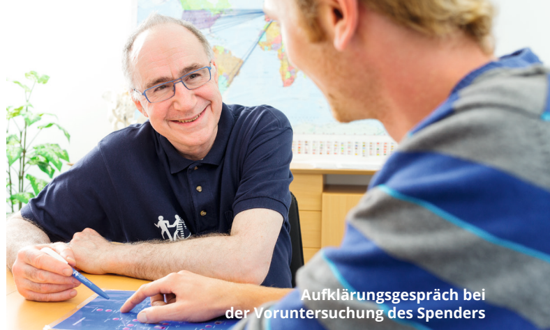
Aufklärungsgespräch bei der Voruntersuchung des Spenders